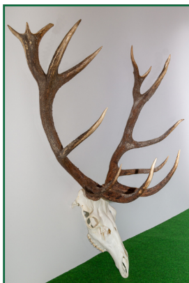
Jelen 7. místo: 191,68 CIC stříbro 171 kg - 10 let - 3.9.2021 Lovec: Soustružník Vítězslav Honitba: Hložec