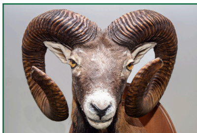
Muflon 4. místo: 206,50 CIC zlato 28 kg - 5 let - 2.8.2021 Lovec: Drga Vlastislav Honitba: Újezd u Valašských Klobouk