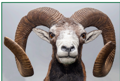
Muflon 5. místo: 204,55 CIC stříbro 6 let - 7.9.2021 Lovec: Tšedop Adal Honitba: Obora Títěž