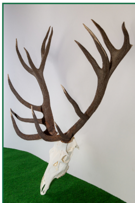
Jelen 10. místo: 187,65 CIC bronz 128 kg - 9 let - 8.9.2021 Lovec: Novák Rostislav Honitba: Nedašov