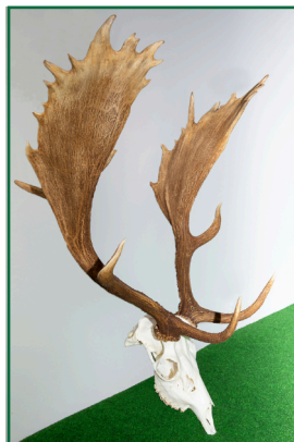
Daněk 12. místo: 173,10 CIC stříbro 55 kg - 4 roky - 7.1.2022 Lovec: Dubovský Miroslav Honitba: Fryšták - Dolní Ves