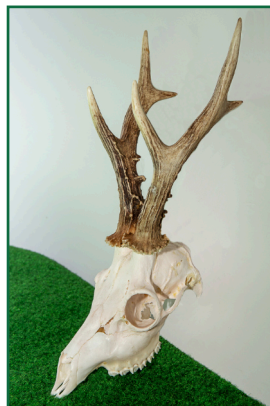
Srniec 9. místo: 105,95 CIC bronz 18 kg - 3 roky - 7.7.2021 Lovec: Pethő Tibor Honitba: Louky - Prštné