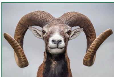
Muflon 2. místo: 209,25 CIC zlato 6 let - 6.9.2021 Lovec: Tšedop Adal Honitba: Obora Títěž